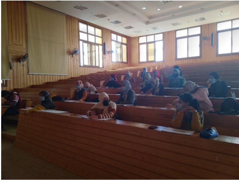
اتباع الاجراءات الاحترازية والتباعد بين الطلاب أثناء المحاضرات

تم تطبيق التعليم الهجين واعتماده بمجلس الكلية رقم (١) بتاريخ ٢٣/٨/٢٠٢٠م. (مرفق رقم