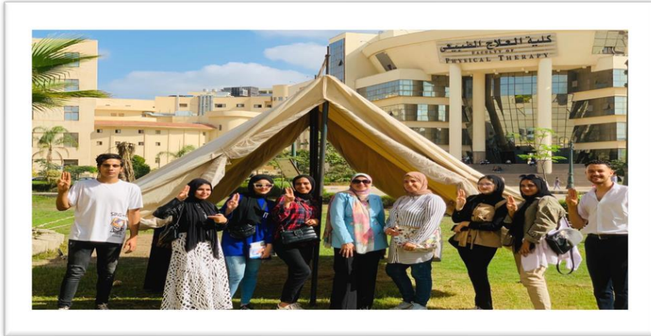
٣- حفل الختام وفوز كلية التربية النوعية بالمركز الثالث مكرر