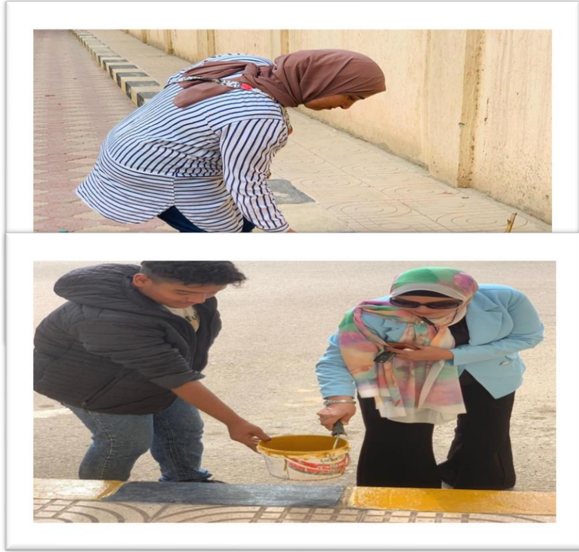
٢-مشاركة لجنة الجواله في الأسبوع البيئي الثاني لجامعة كفر الشيخ