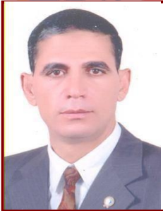
أ.د/ حسن حسن عبدالله يونس نائب رئيس الجامعة للدراستات العليا والبحوث