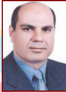
أ.د/ ماجد عبد التواب القمري رئيس الجامعة