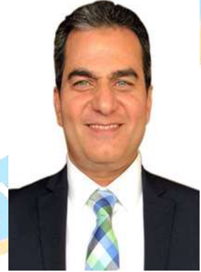
أ.د/ محمد عبدالعال نائب رئيس الجامعة لشؤون التعليم والطلاب