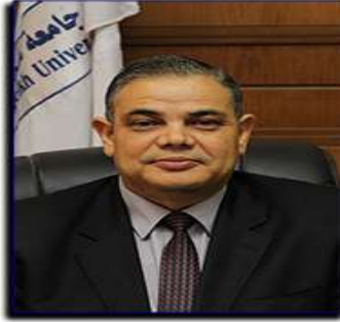
أ.د/ عبد الرازق يوسف الدسوقي رئيس الجامعة