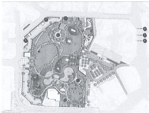
اسكتش يوضح الاماكن المقترحة لتوزيع الاكشاك بالموقع العام