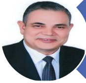
أ.د/ عبد الرازق يوسف الدسوقي رئيس الجامعة