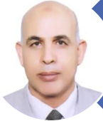
أ.د/ اسماعيل اسماعيل ابراهيم السيد نائب الرئيس للدراسات العليا والبحوث