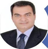
أ.د/ محمد مصطفى عبدالعال نائب الرئيس لشئون التعليم والطلاب