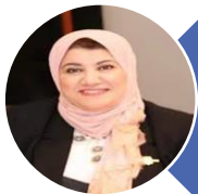
أ.د/ أماتي محمد شاكر نائب الرئيس لخدمة المجتمع وتنمية البيئة