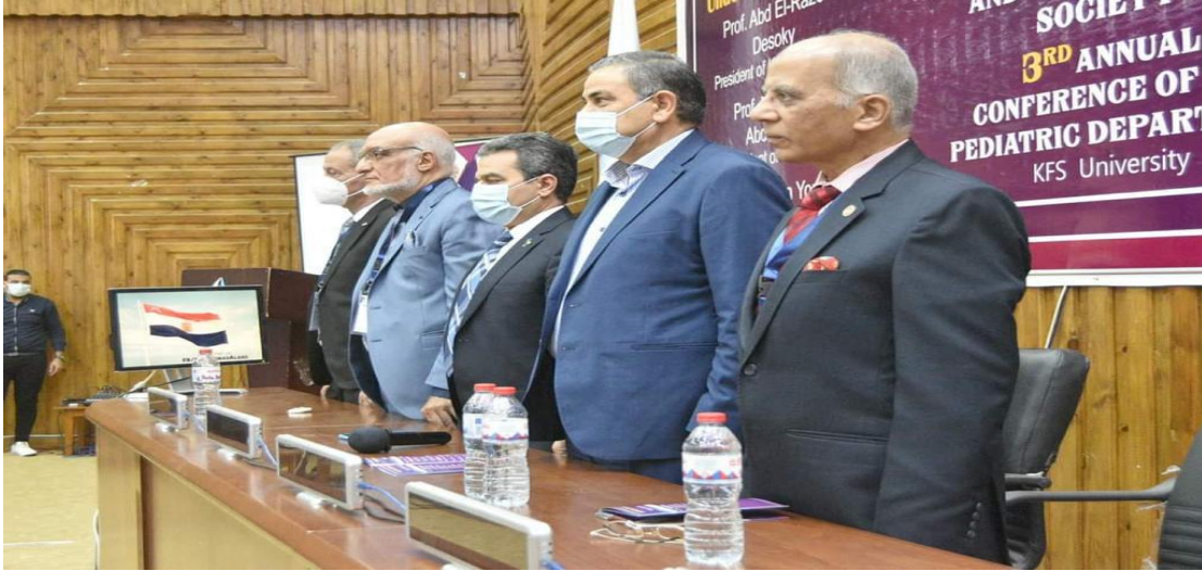
المشاركة في اداره احدي جلسات مؤتمر الكلية الثاني