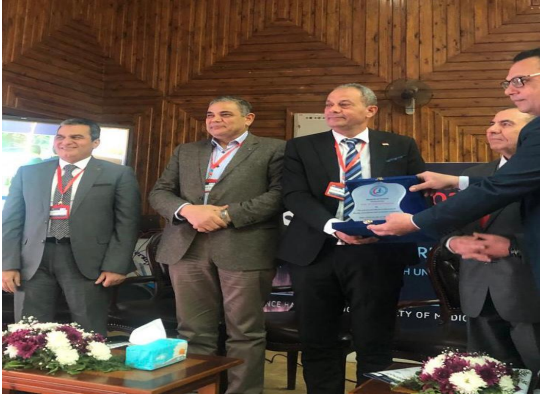
تكريم رئيس القسم في مؤتمر الكليه الثاني 2022/3/25