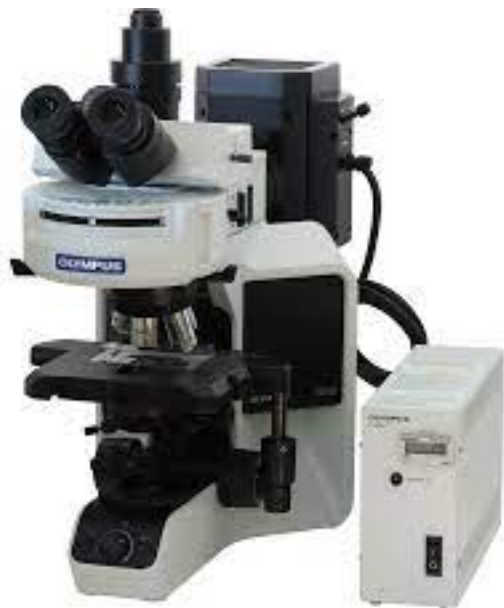
Multihead Teaching microscope •