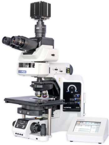
Fluorescent Trinocular microscope •