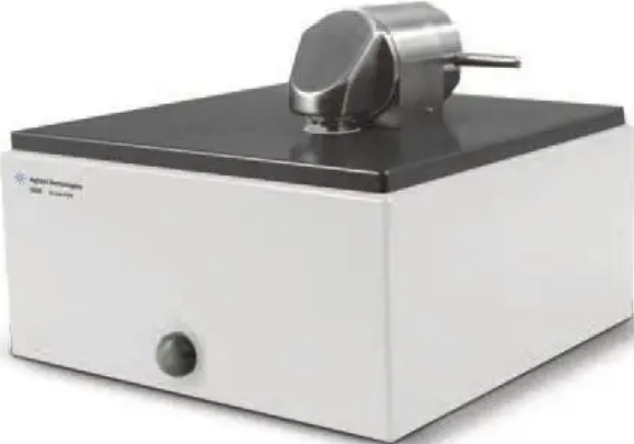
HPLC analyzer •