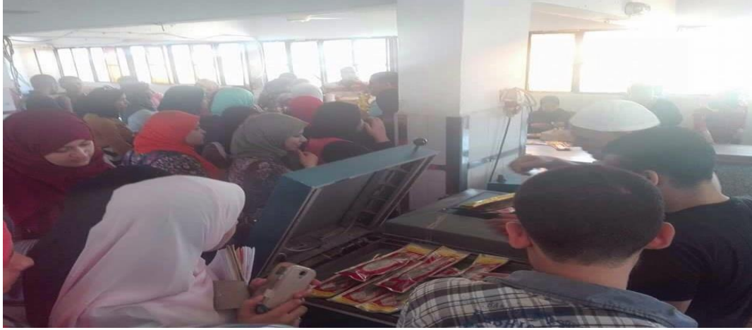
زيارة لأحد مصانع تدخين الأسماك ( مصنع الرنجة )