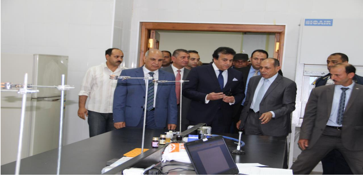
معالي السيد الأستاذ الدكتور / خالد عبد الغفار وزير التعليم العالي و البحث العلمي ( خلال زيارته لأحد معامل الكلية )