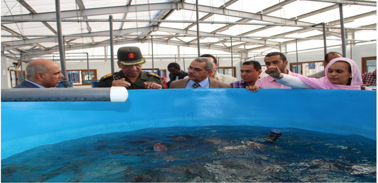
سعادة السفيرة أثناء إلقائها الطعام للأسماك ( الصورة من داخل مجمع الأحواض السمكية الملحق بالكلية )