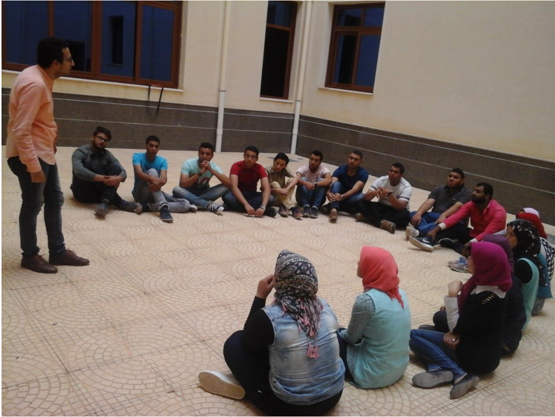
جانب من تدريبات المسرح بالكلية