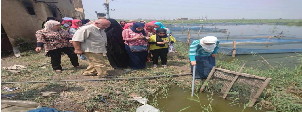
احدى الطالبات تقوم عمليا بجس المياة لمعرفة شفافية المياة