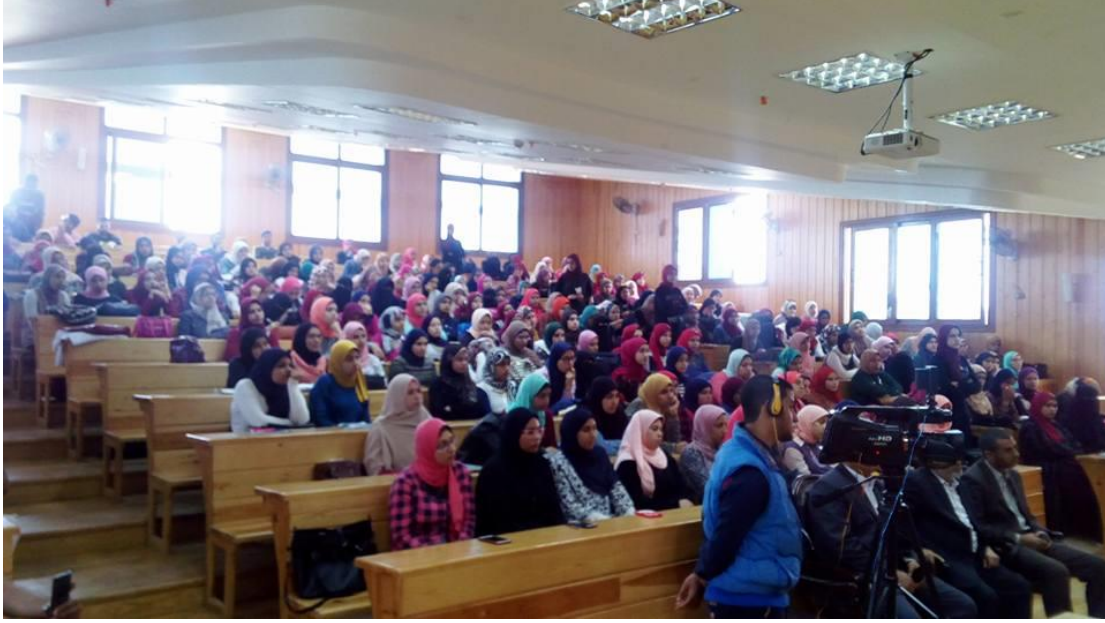
جانب آخر من الحضور للندوة الدينية