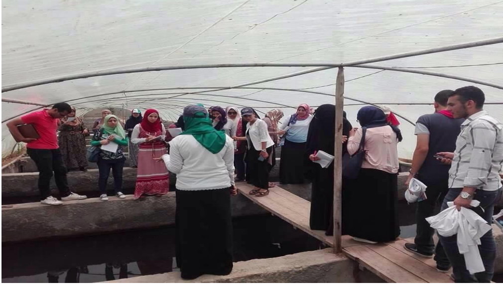
من داخل صوبة مفرخ سمكي