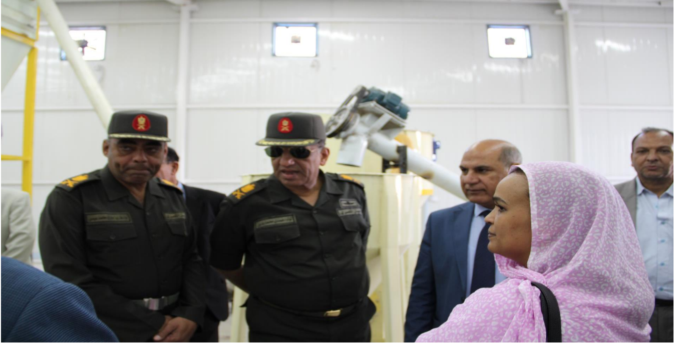
زيارة سفيرة دولة موريتانيا مع قيادات من الجيش المصري ( الصورة داخل مصنع الأعلاف التعليمي الملحق بالكلية )