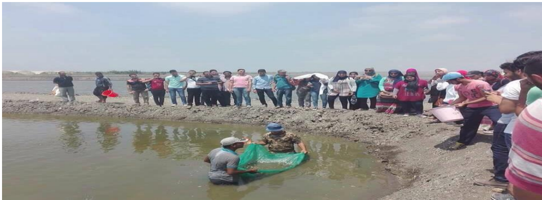
عملية وزن السمك