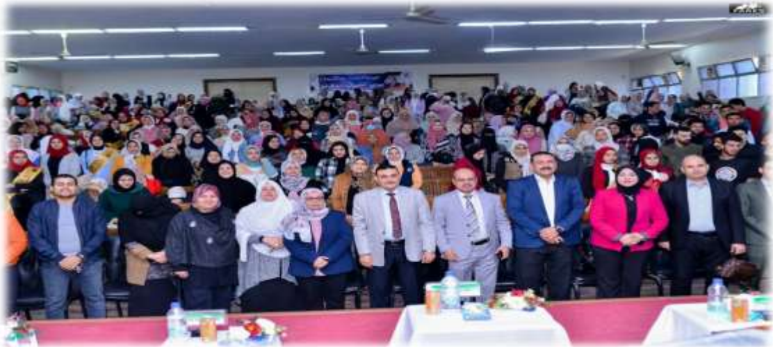
-المشاركة في الافطار الجماعي بشهر رمضان الكريم الذي أقامة الأستاذ الدكتور عبدالرازق الدسوقي رئيس الجامعة وأسرة طلاب من أجل مصر ٢٠٢٣/٤/٤م: