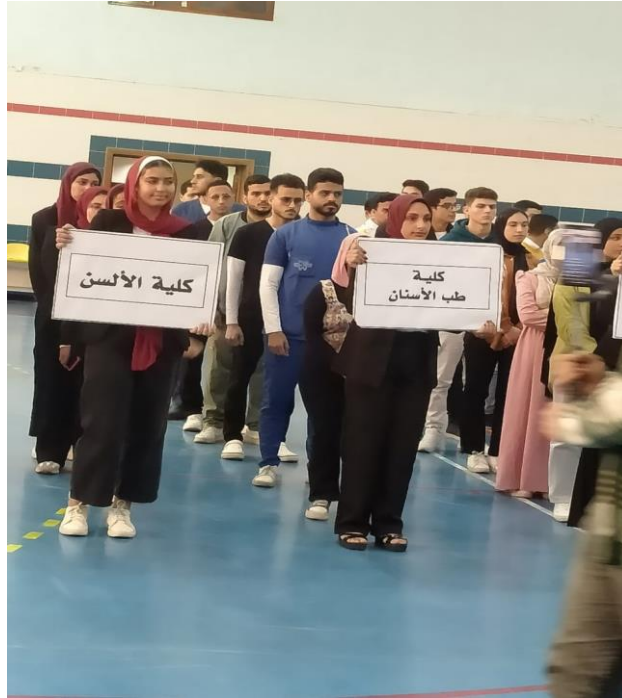
طابور العرض والافتتاح