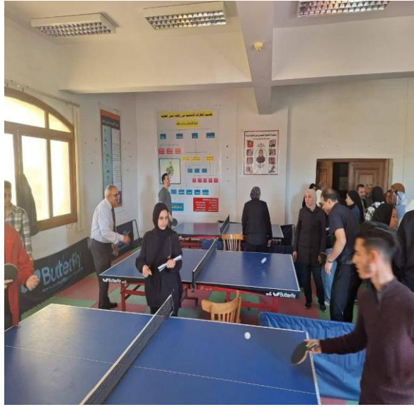
دوري تنس الطاولة